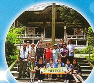
2019.7.2 氷見市上日寺を訪ねて