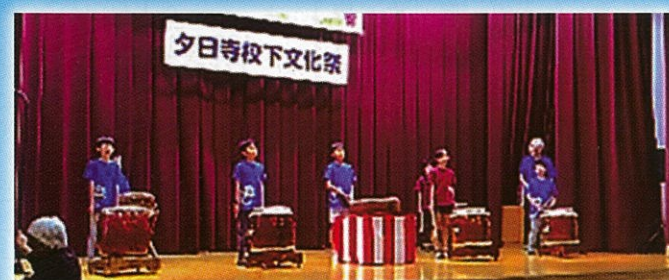
オープニング (夕日子ども体験教室金龍太鼓)