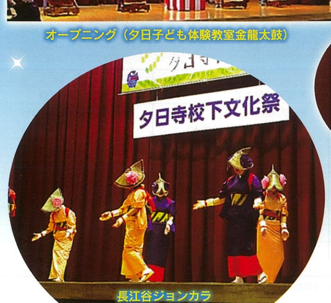
長江谷ジョンカラ