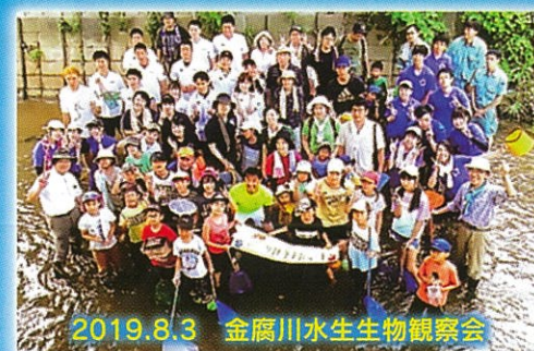
2019.8.3 金腐川水生生物観察会