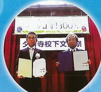
氷見市観光協会との友好提携式