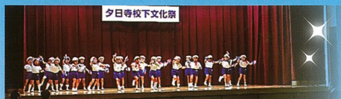
アトラクション (山王こども園:パプリカ)